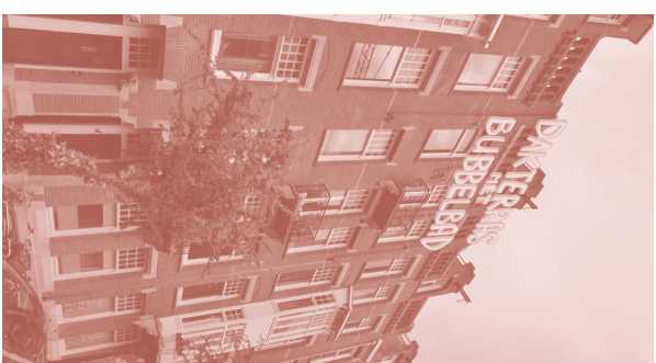
Lily van der Stokker, Dakterras met Bubbeldad , 2021, schets voor Valeriusstraat

Lily van der Stokker (1954, Den Bosch, NL) has been internationally known since the 1990s for her optimist drawings and murals in bright colours. Her cheerful drawings are made in her own palette of fluorescent colours. She often draws motifs such as flowers, curls and clouds. Van der Stokker combines these shapes with words or sentences that are very recognizable. Because of this combination of sweetly coloured shapes and short pieces of text, her works of art seem easy and accessible. But that is only an illusion. In her own words, she makes 'difficult art that looks easy'.