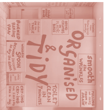
Lily van der Stokker, The Tidy Kitchen (detail), 2015, Hammer Museum, Los Angeles, VS

Sinds de jaren '90 is Lily van der Stokker (1954, Den Bosch, NL) internationaal bekend om haar optimistische tekeningen en muurschilderingen in felle kleuren. Van der Stokker's schilderingen zijn gemaakt in haar eigen byzondere palet van fluorescerende kleuren. Ze tekent vaak motieven als bloemen, krullen en wolken. Dit combineert Van der Stokker met woorden of zinnen die heel herkenbaar zijn. Door deze combinatie van zoet-gekleurde vormen en korte stukjes tekst lijken haar kunstwerken gemakkelijk en toegankelijk. Maar dat is alleen maar schijn. Naar eigen zeggen maakt ze 'moeilijke kunst die er makkelijk uitziet'.